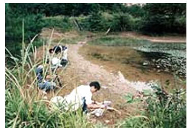
里山活動：ため池の調査

河川の流域の自然景観の特徴を理解し、生物の様相を知り、さらに里山における人の暮らしと生き物との共生に目を向けていきました。壮大な自然の絵巻物を示され、見られなくなった希少生物への愛着で思わず声を高められたので、共感しました。