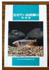
生きている武庫川

3年に1冊の本づくりを目標に掲げて地道な調査を重ねるのが柱で、武庫川・猪名川・揖保川・大和川など特徴的な河川流域の報告書を4種発行し、35000冊を小・中学校に寄贈されました。