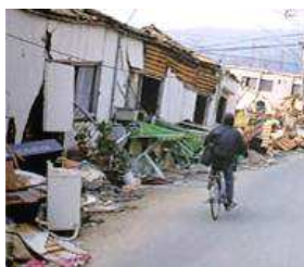
同じ方向に倒れた

地震で倒壊した木造家屋がどの方向に倒れたかが調査され、地域によって同じ方向に倒れている事実が分かった。私の推測では、揺れはじめの4～7秒後のものすごく大きな一発のゆれで倒れたのではないと思う。激しい衝撃で、石や人が飛んだという話もある。