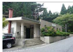
六甲山地域福祉センター

24名の参加者には適度な広さで快適でした。午後から雨になり視界も悪くなったので、六甲ケーブル山上駅の天覧台から大阪湾を眺望してお話を聞く予定は変更し、室内での講演に集中しました。