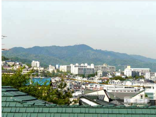
飛松中学校からの六甲山

実施日：平成21年9月12日（土） 午後1時～3時30分 場 所：六甲山地域福祉センター