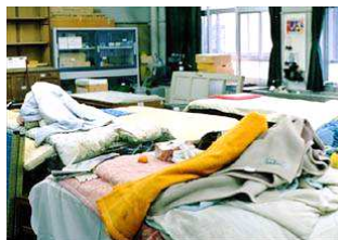
避難所になった理科室

震災のとき、理科室は学校で最良の避難場所だった。水道・ガスがある。仕方がないが、困った。学校以外に地域の防災拠点が必要だと思う。