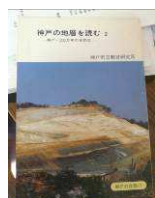
『神戸の地層を読む』