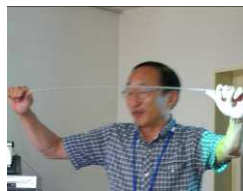
ガラス棒を曲げる実験

講演の冒頭、ガラス棒に力を加える実験で、地震が起こる本質を説明されました。工夫を凝らして難しいと思う地学を分かり易く話されました。熱意のこもった講演に接した皆さんが感銘を受け、基礎学力を高めるという大きな刺激を受けました。