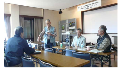
出席者の発言も活発