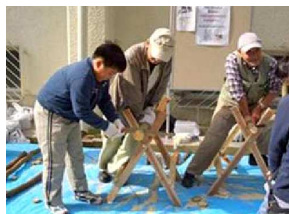
子どものキコリ大会

毎年1回だけ、地域の方と自治会と一緒にふれあい祭りをしており、われわれもスタート当初から参画している。その内は4つで、1つは先ほどの堆肥、それと花や蝶のしおり・カレンダーなどを販売。そしてお子さん対象のキコリ大会、さらにドングリ工作やダーツ遊びを、毎年やっている。