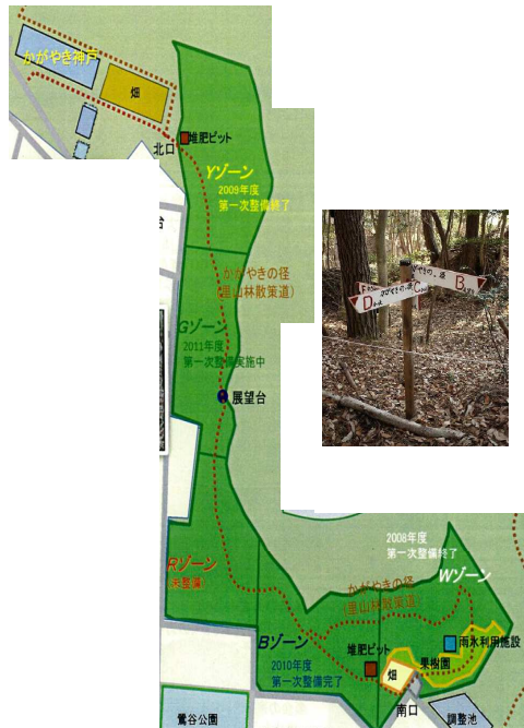
かがやきの森全景

日々の活動は週の月曜日を活動日にし、7つのチームに分けて、年間40日間ぐらい活動している。まず活動の計画を作成したものをメールで配信する。そして当日集まってミーティングをし、約3時間の作業をする。その後は各チームでしてきたことを発表し、記録に取っている。情報の共有化に努めているわけで、これを繰り返しやっている。