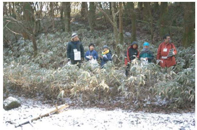
2ツ池で自然観察をする