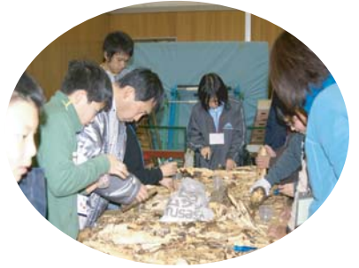
ほだぎの中から冬の虫を探す

国立公園を中心に自然環境の保全を行なっている自然保護官(パークレンジャー)。国立公園である六甲山を、子どもパークレンジャーとして体験しませんか？自然とのつきあい方やその大切さを学んでみよう！