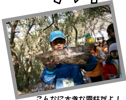
こんなに大きな霜柱だよ！

近頃、冬の風情を感じる事が少なくなりました。 そんな環境の中にいる子供達に、冬の六甲山で、季節感を発見して楽しんでもらう企画です。大盛況だった平成17・18年に引き続き、平成19年も開催します。子供さんとご家族の方、さらに支援していただける方など、みんなでいっしょに六甲山の冬を探検しましょう！