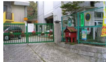
探検基地は六甲山小学校だ！

費用：300円/1人（保険料込み） 定員：100名。ご家族、老若男女どなたでも参加OK 持ち物：上履き、弁当、飲み物、おわん、おはし、防寒具 ※デジタルカメラをお持ちの方は持参してください。