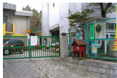
探検基地は六甲山小学校だ!

と き : 平成18年7月30日(日) 午前9時~午後4時 と ころ : 神戸市立六甲山小学校、周辺地域