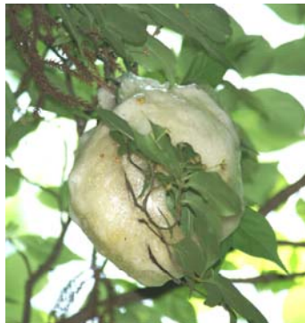
モリアオガエルの卵塊