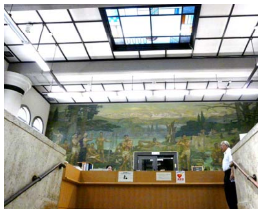
社会科学系図書館 受付の壁画「青春」

午前10時に神戸大学正門(市バス36系統の神大正門前)内側に集合。午前中は出光佐三記念六甲台講堂、本館、兼松記念館、図書館の4つの有形文化財などを見学します。昼食は大学食堂で各自で摂っていただきます。午後は徒歩で第2キャンパスに下り、百年記念館の常設展示や山口誓子記念館を訪ねて、お話しをお聞きます。