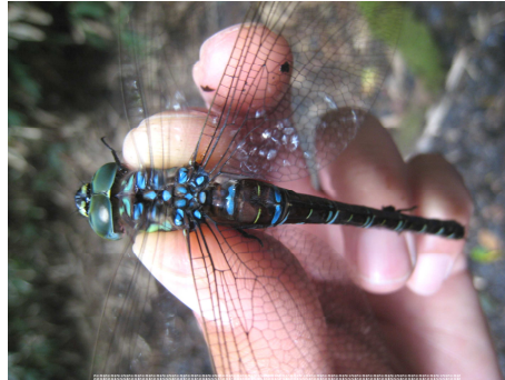
オオルリボシヤンマ