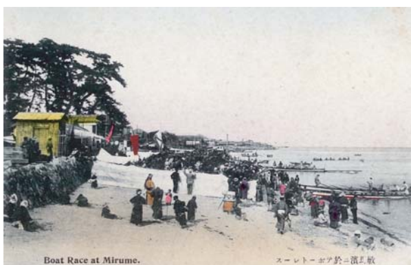
(昭和初期の六甲・絵葉書)