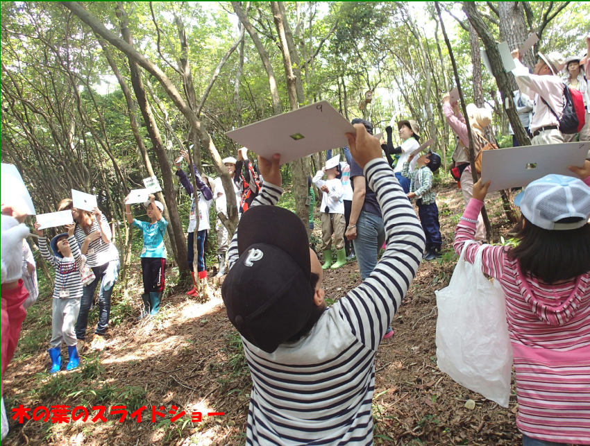
木の葉のスライドショー