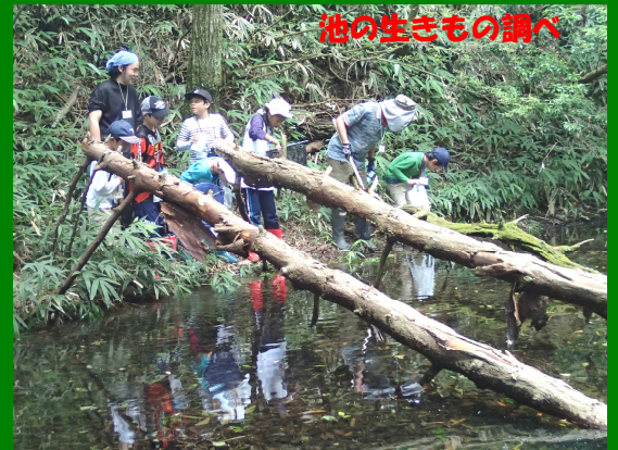
池の生きもの調べ