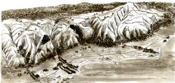
江戸時代の六甲山を描いた絵図

明治時代に植物学者の牧野富太郎が六甲山を見て、木がないので雪が積もっているのを見間違えたという有名な話がある。六甲山は昔からハゲ山だったと言われている。