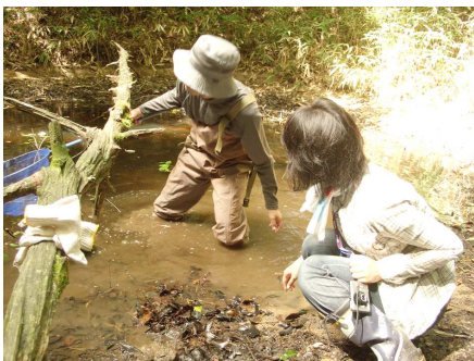
水生生物の調査の様子

午前中は近畿自然歩道を整備し、散策路脇の二ツ池の水生生物を調査しました。整備活動では、メジャーを使って散策路を10mずつ区画分けしていきました。今後は区画ごとに再生した植生を調査し、整備活動の効果を見極めていきます。