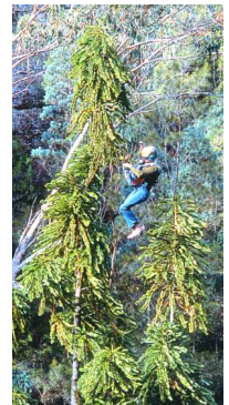
ウォレマイパイン (空中降下して接近)

オーストラリアにブルーマウンテンで有名なウォレマイ国立公園がある。恐竜時代の絶滅植物として考えられていた「ウォレマイパイン」がそこで発見された。この木は「ジュラシック・ツリー」とも呼ばれている。神戸の姉妹都市のブリスベンから寄贈を受けて、植物園に去年植えた。日本ではまだそんなに出回っていない。まだ1mぐらいの高さだが、新しい目玉になる。ぜひ一度見ていただきたい。