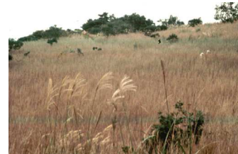
1970年代の東おたふく山

神戸市は草刈をして背の高さを低く抑えているが、予算不足で全部はカバーしきれない。管理をしないと、他の草原性の植物がなくなってしまう。