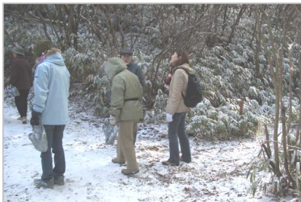
散策路の点検と整備について検討

午後は21名の熱心な参加者が揃いました。新しい顔ぶれもあり、和やかに講演が始まりました。