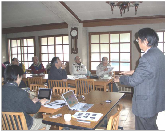
六甲山の植生の由来を知る