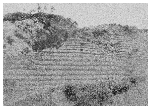
明治時代の植林(再度山)

六甲山は江戸時代にはハゲ山だったと言われている。六甲山は人間の手が入る以前は、おそらくシイ・カシの林だった。人間が燃料や墨、建材として伐採し、やがてアカマツやコナラの林になった。さらに伐採を続けて土壌が劣化・流出し、ハゲ山になった。大雨が降ると洪水が起こるようになり、明治時代に植林がされることになった。