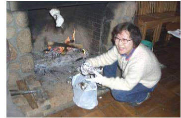
もはや名物！中川亭のやきいも