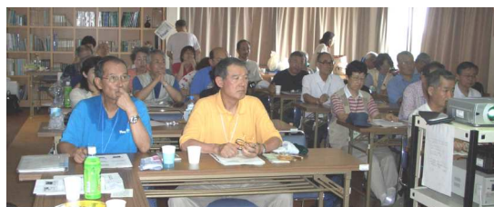
参加者43名と盛況でした

花の写真撮影はド素人で、試行錯誤しながらド素人なりにいろいろ工夫して撮影している。