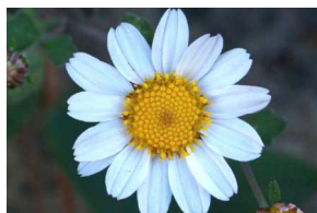
リュウノウギク (10月)