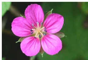
ゲンノショウコ (8～9月)