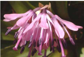
ショウジョウバカマ (3～4月)