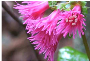
オオイワカガミ (5月)