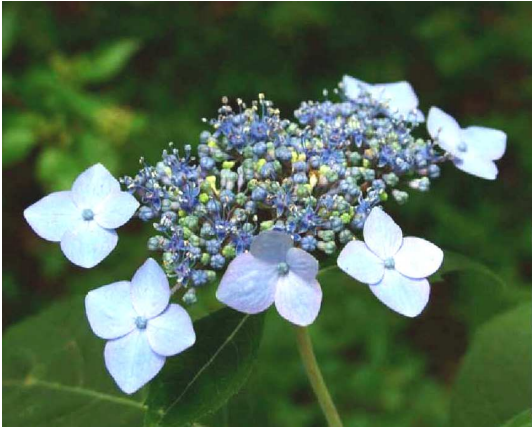
ヤマアジサイ