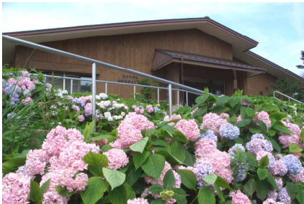
自然保護センターのアジサイが満開でした

午前中のボランティア活動では、散策路脇の笹を刈りました。作業中、大勢のハイカーとすれ違いました。連休初日で山上は大賑わいでした。