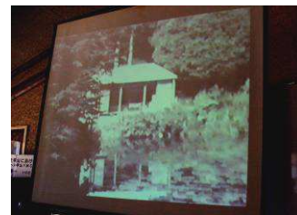
貴重な記録ビデオを視聴