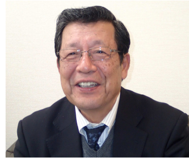
＊ ＊ プロフィール ＊ ＊

12年前の第26回市民セミナーで、「六甲山の景観計画を考える」をテーマに、都市林としての六甲山の魅力や、景観計画への市民の関与の大切さなどをお話しました。あれから、土地利用に対する世界の動向は大きく進展しています。六甲山の景観マネジメントも再構築に迫られており、市民の関心を高める必要があります。