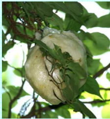
モリアオガエルの卵塊

そこにはモリアオガエルがたくさん棲んでいます。池のそばの樹木にソフトボールの大きさの真っ白な卵塊を産み付けるという珍しい繁殖をします。今年ほどたくさん多いか、みんなで調べてみましょう。