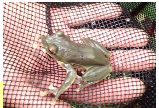
小さなモリアオガエル