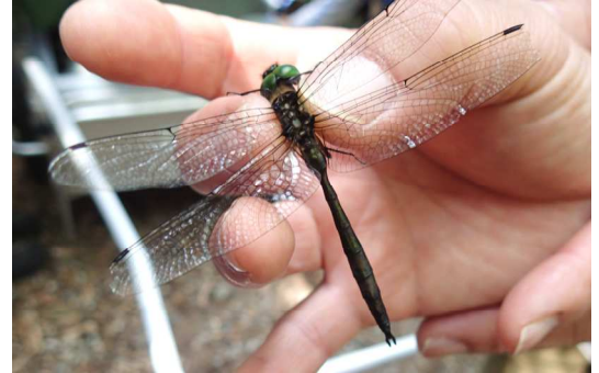
ルリボシヤンマをつかまえた！