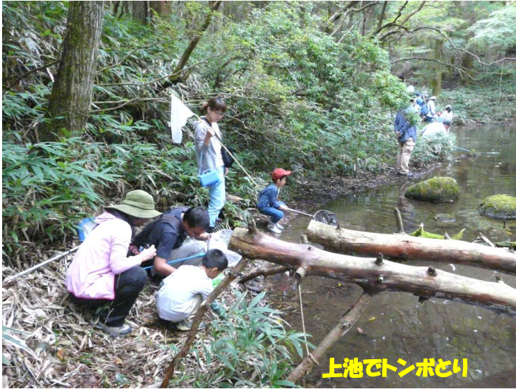
上池でトンボとり

ルリ色に輝く美しい大型の「オオルリボシヤンマ」を探します。二つ池の水生生物も調べましょう