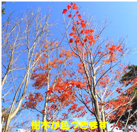
樹木が色づきます