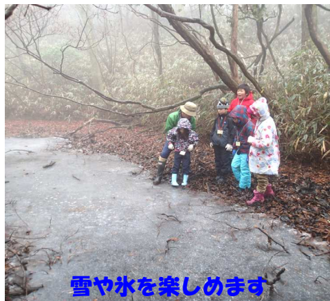
雪や氷を楽しめます