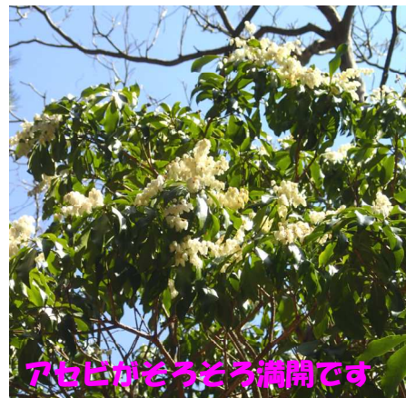
アセビがそろそろ満開です