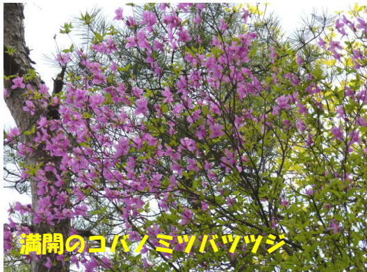
満開のコハノミツバツツジ