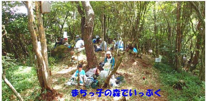
まっちゃんの森でいっぶく