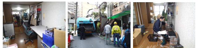
産廃物の搬出準備

現在の事務所を3月末で移転することにし、2月に引き続いて事務所の書類や器材の整理を行いました。灘図書館に蔵書500冊、六甲山郵便局や勤労市民センターに事務器材、「あすパーク」にもコピー用紙を寄贈しました。3月17日(火)には産廃業者に託して2トントラック2台以上の不燃物や紙類を破棄しました。その後も使用品の移転のために整理を続けています。