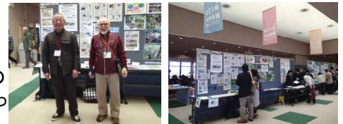
1時間ほどで展示を完了