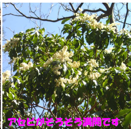
アセビがそろそろ満開です