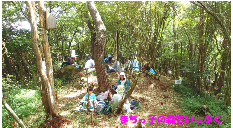
まっちゃんの森でいっぶく