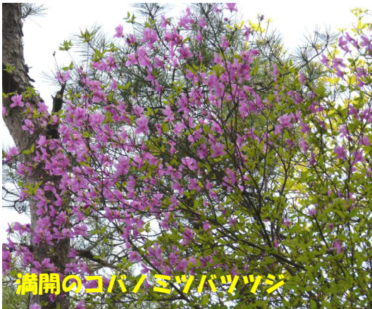
満開のコバノミツバツツジ