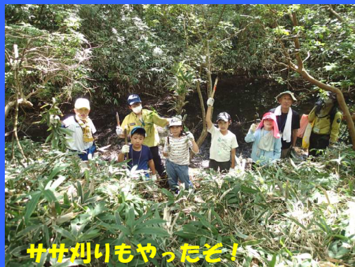
ササ刈りもやったぞ!