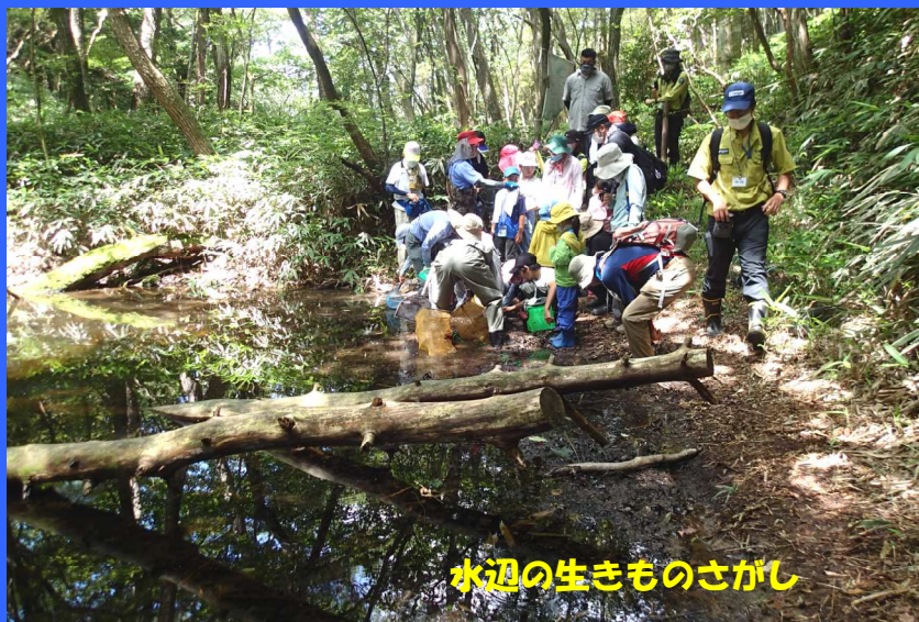
水辺の生きものさがし