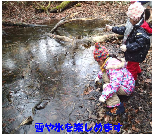
雪や氷を楽しめます