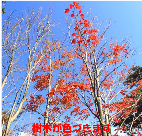
樹木が色づきます