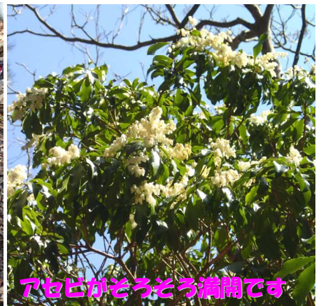
アセビがそろそろ満開です