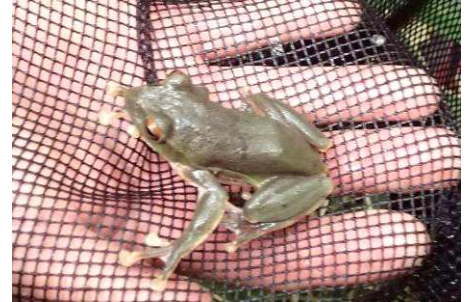
小さなモリアオガエル