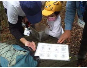
⑫さっそく、図鑑で確認