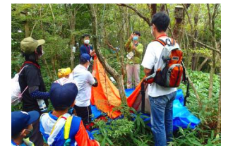
⑦グループでタープ張り