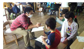
⑱研究チームのまとめ

捕まえた: ヤゴ、オオコミムシ、クロイトトンボ、オタマジャクシ、ゲンゴロウ 見た: オオルリボシヤンマ、マツモムシ、モリアオガエル、クロイトトンボ、タカトトンボ、木の実、キノコ