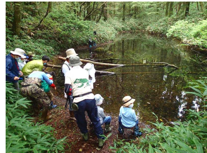
⑧上池で「静かな観察」