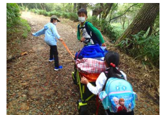
⑥研究チームが用具を運搬