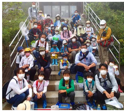
⑤ビジターセンター前で38名集合