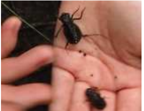
⑪オオルリボシヤンマのヤゴ