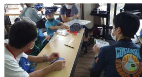
⑩センターで活動のまとめ

捕まえた: ヤゴ、オオコミムシ、クロイトトンボ、オタマジャクシ、ゲンゴロウ 見た: オオルリボシヤンマ、マツモムシ、モリアオガエル、クロイトトンボ、タカトトンボ、木の実、キノコ