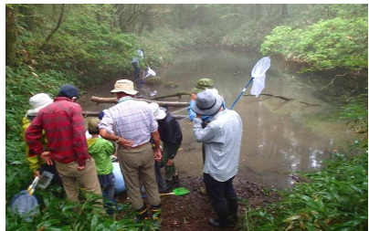
⑩上池で生きもの調べ