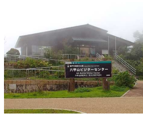
②霧のビジターセンター