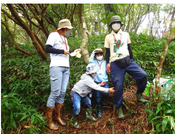
⑭家族のマイウッド