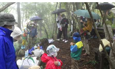
⑬小雨の中、初参加の家族は「まちっ子の森」を散策