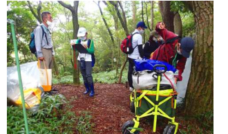
⑰用具を片付けて撤収