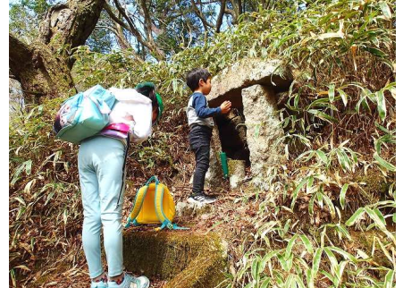
巡礼終盤の6体の石仏を拝観

六甲山の「素朴な森と歴史の散歩道」を散策・整備します。「西国三十三カ所巡り」の石仏も200年間たたずんでいます。貴重な歴史文化遺産を見守りましょう！