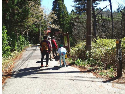
平坦なシュラインロード