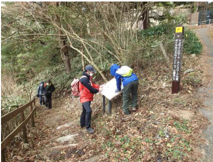
まちっ子の森と散歩道の散策