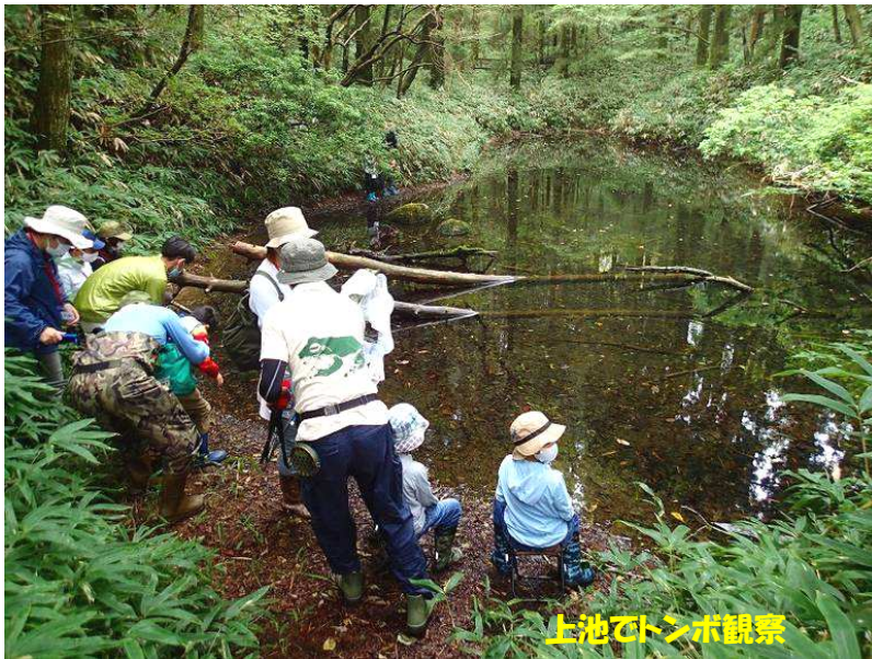
上池でトンボ観察