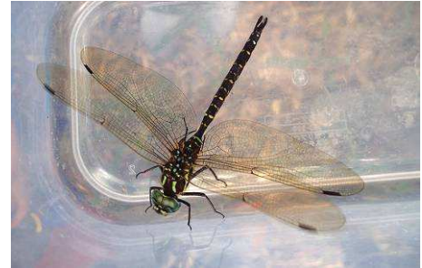
オオルリボシヤンマ

初秋の「まちっ子の森」で、ルリ色に輝く美しい大型の「オオルリボシヤンマ」を探し、池の水生生物も調べます