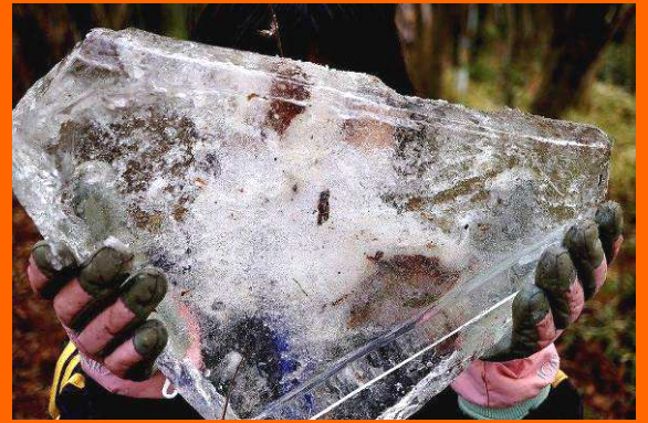
氷の厚さは5cmもあるよ