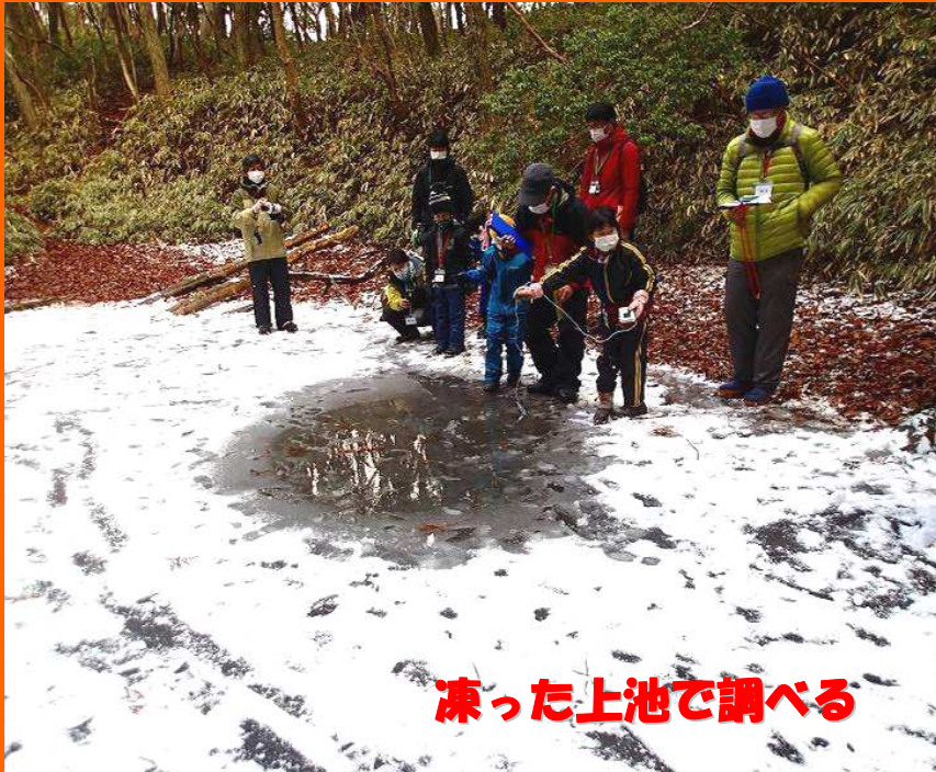
凍った上池で調べる