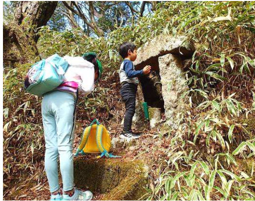
6体の「石仏めぐりあい散歩」