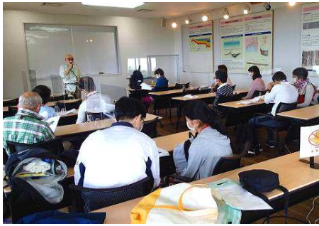
「石仏講座」でいろいろなお話