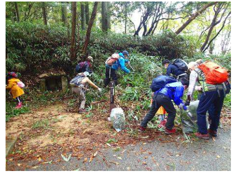
石仏周辺の見守り活動

六甲山の「素朴な森と歴史の散歩道」を散策し整備もします。「西国三十三カ所巡り」の石仏が200年近くたたずんでいます。貴重な歴史文化遺産を見守りましょう！