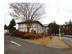
至六甲山サイレンスリゾート