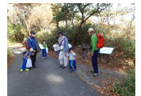
シュラインロード西分岐