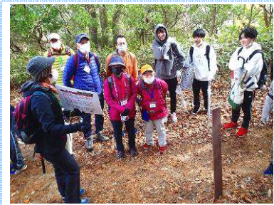
6. 北端の第28番石仏に到着