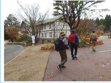
3. サイレンスリゾート東側