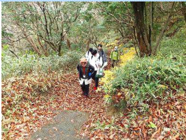
4. シュラインロードの西分岐