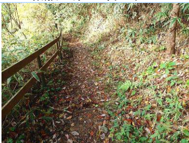
13. ササ刈りした散歩道