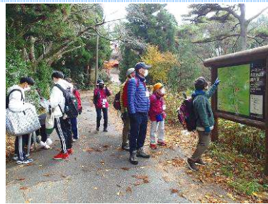
5. ノースロード分岐