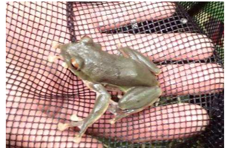
小さなモリアオガエル

※小雨決行、雨具をご持参ください。 モリアオガエルが活動します。 悪天中止の場合は予備日の 6月25日 に順延します。 募集定員:30名(先着順) 募集対象:小学3年生以上の学童、一般、 親子参加は5歳以上 参加費:500円(傷害保険・教材費実費) 集合場所:県立六甲山ビジターセンター 指導者:久門田 充氏他、運営スタッフ