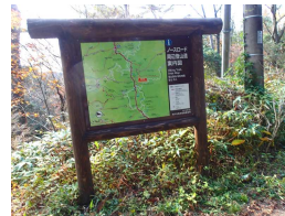
ノースロード分岐

六甲山ガイドハウス発 (5分) ~ 六甲山サイレンスリゾート (10分) ~ シュラインロード東分岐・西分岐 (30分) ~ 北端の第28番石仏 (Uターン、6体石仏めぐり、30分) ~ 結願の第33番石仏 ~ 前が辻 (15分) ~ 六甲山ガイドハウス着