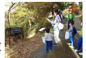
シュラインロード東分岐