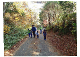
シュラインロード