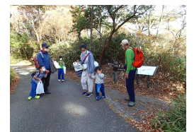
シュラインロード西分岐