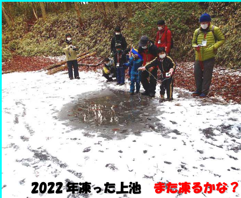
2022年凍った上池 また凍るかな?