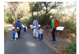
シュラインロード西分岐