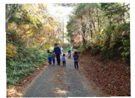
シュラインロード