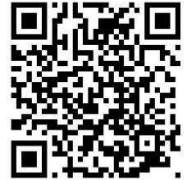
「石仏ガイド」QRコード