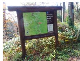
ノースロード分岐

六甲山ガイドハウス発 (5分) ~ 六甲山サイレンスリゾート (10分) ~ シュラインロード東分岐・西分岐 (30分) ~ 北端の第28番石仏 (Uターン、6体石仏めぐり、30分) ~ 結願の第33番石仏 ~ 前が辻 (15分) ~ 六甲山ガイドハウス着