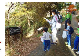
シュラインロード東分岐