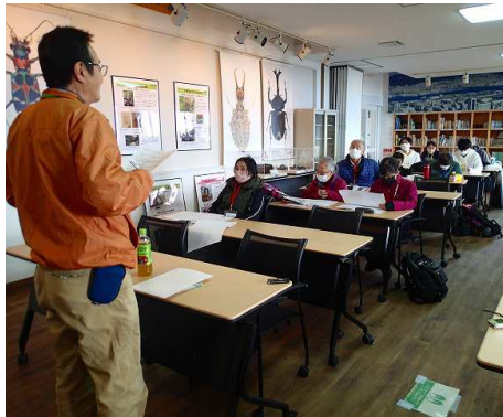
「石仏講座」でいろいろなお話