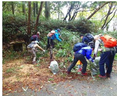
石仏周辺の見守り活動

シュラインロードに「西国三十三カ所巡り」の石仏が200年たたずんでいます。「森と歴史の散歩道」を散策し整備します。貴重な歴史文化遺産を見守りましょう！