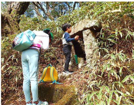
6体の「石仏めぐりあい散歩」