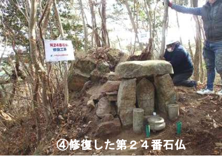
④修復した第2番石仏

シュラインロードに「西国三十三カ所巡り」の石仏が200年たらずんでいます。六甲山の貴重な歴史文化遺産です。石仏探勝のご案内をします。ご参加ください！