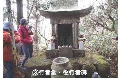
③行者堂・役行者碑