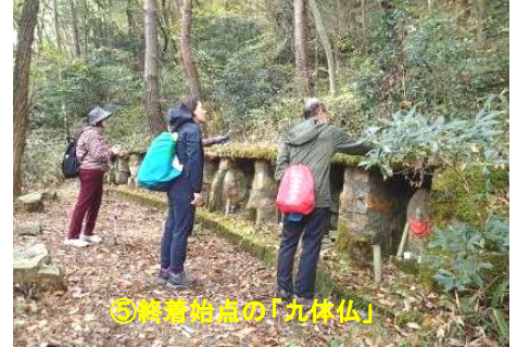
⑤麓着地点の「九体仏」

シュラインロードに「西国三十三カ所巡り」の石仏が200年たらずんでいます。六甲山の貴重な歴史文化遺産です。石仏探勝のご案内をします。ご参加ください！