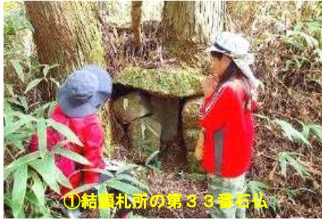
①結願札所の第3番石仏