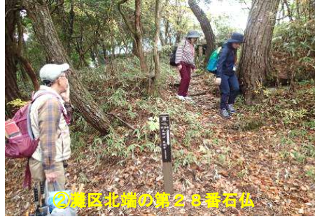
②灘区北端の第2番石仏