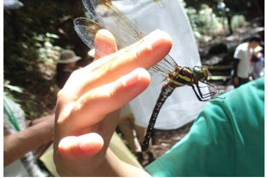
オオルリボシヤンマ

初秋の「まちっ子の森」で、ルリ色に輝く美しい大型の「オオルリボシヤンマ」を探し、池の水生生物も調べます